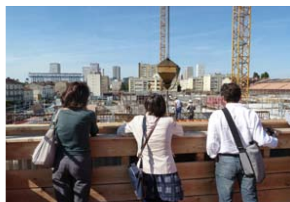
Belvédère de l'Atelier/TRANS305

L'Atelier/TRANS305, qui accompagnera les chantiers de la ZAC du Plateau jusqu'en 2013, donne une nouvelle dimension au programme TRANS305, prototype de la démarche HQAC.