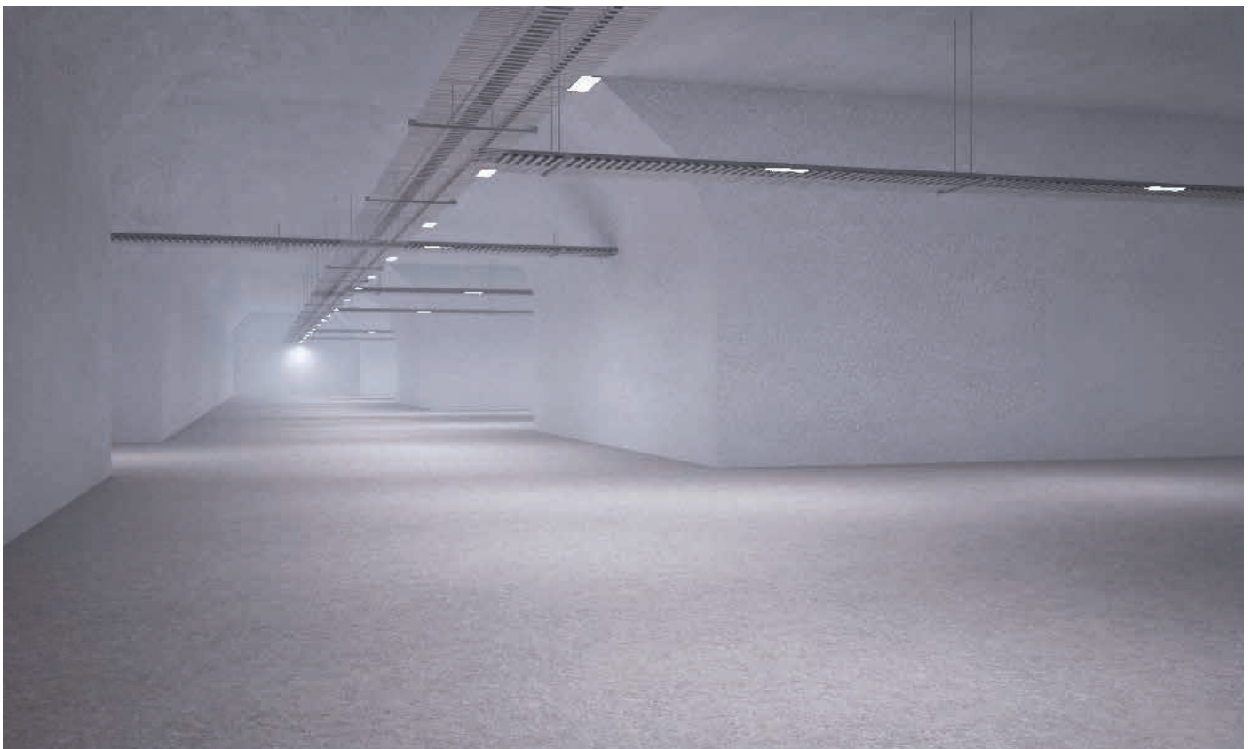
Magali Daniaux & Cédric Pigot, Devenir Graine . Modélisation 3D de l'intérieur du Global Seed Vault © Magali Daniaux & Cédric Pigot